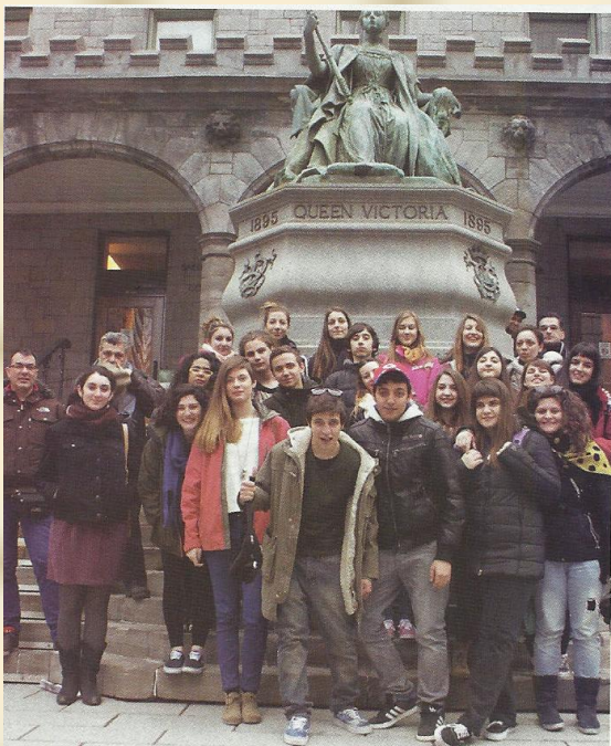
Από την επίσκεψη στο Τορόντο

Zinn, H. 1995. A People's History of the United States , 2d ed. New York, NY: HarperCollins. This book chronicles United States history from 1492 through 1992 from the point of view of those whose voices have been omitted from most histories.